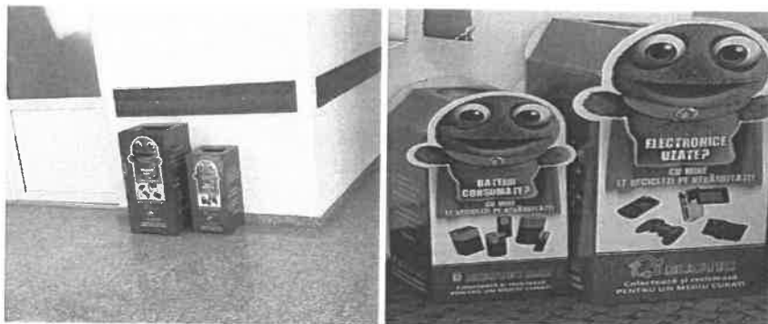
Recipiente pentru baterii si DEEE-uri mici in primarii si scoli

- Recipiente de colectare distribuite in scoli si primarii – colectare periodica.